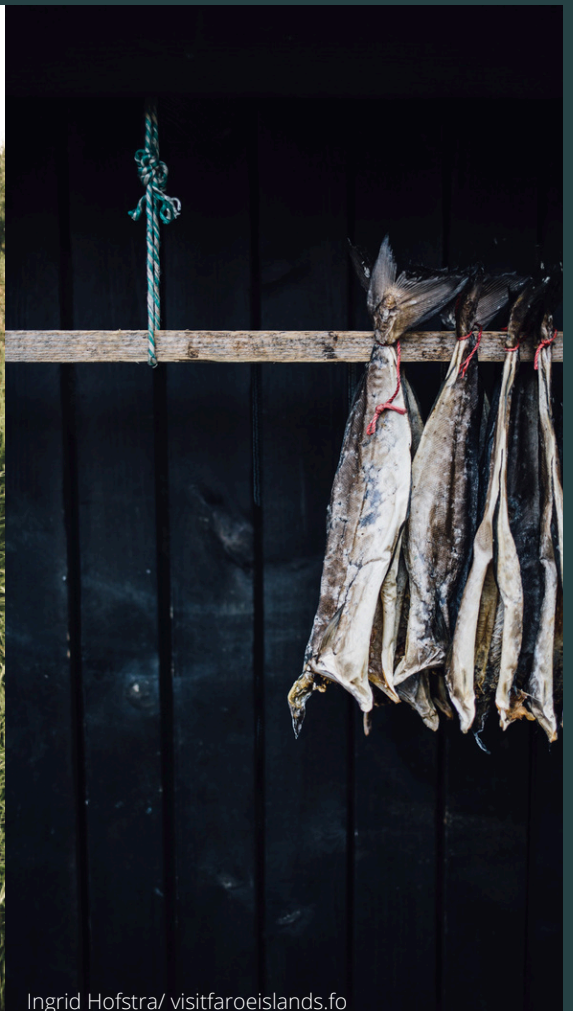
Ingrid Hofstra/ visitfaroeislands.fo